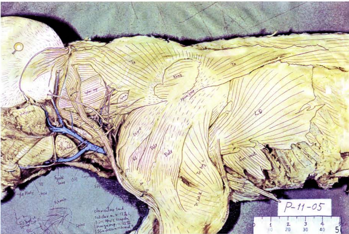
図2 図1の写真を上質紙に印刷し、直接鉛筆で上書きし、水洗により色落としをして得られた線画。全体にややシアン系統の色が残り、また水洗・乾燥による用紙のしわが見られるが、特に問題はない。