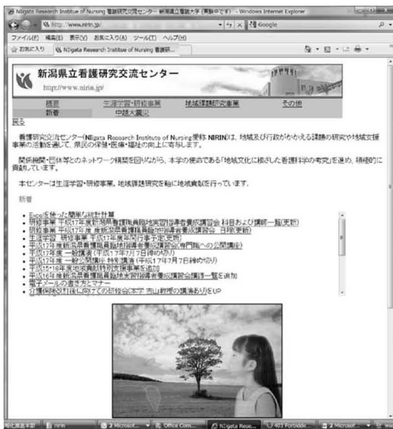
図 1 旧実験中のホームページ

本センターの IT 部会の実験として、情報公開の大きな問題となる判明した点を列記する。旧来型の情報発信を改善した自動ホームページ作成機能をもつホームページを作成した(図 1, 図 2)。