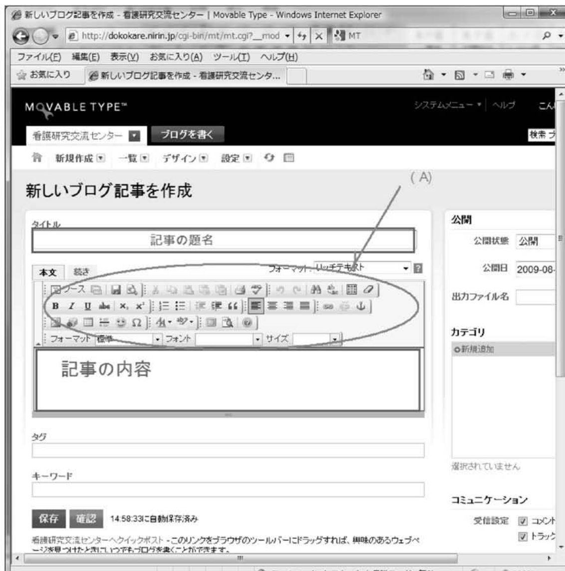
図 5 記事記載画面