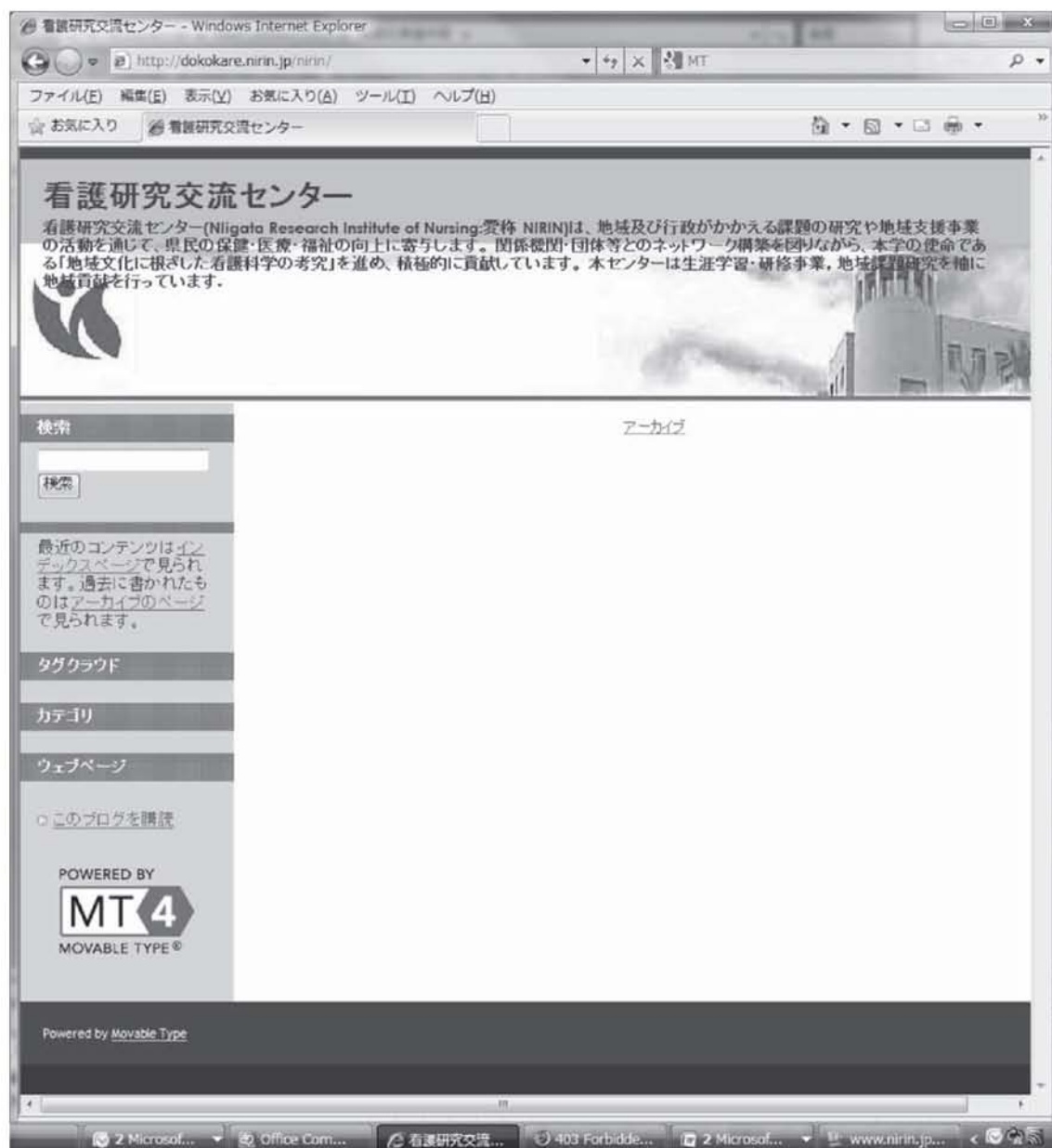
図 3 MT で作成した看護研究交流センターのホームページ(試験)

MOVABLE TYPE 4, (以下 MT) はホームページを構成する三つの要素, 日々の更新世, ページの構成, ファイルのすべてを, ウェブブラウザから簡単に管理できる機能を持つ. これは, 平成 17 年度交流事業で導入したソフトウェアである. これを平成 20 年度に更新し, ホームページを構成した. 以下にホームページを作成する時に必要な 2 画面として, デザイン選択画面を図 4, 記事記載画面を図 5 に示す. 記事記載方法はワープロソフト同様な操作を行い, 保存することによりホームページが容易に作成可能となる.