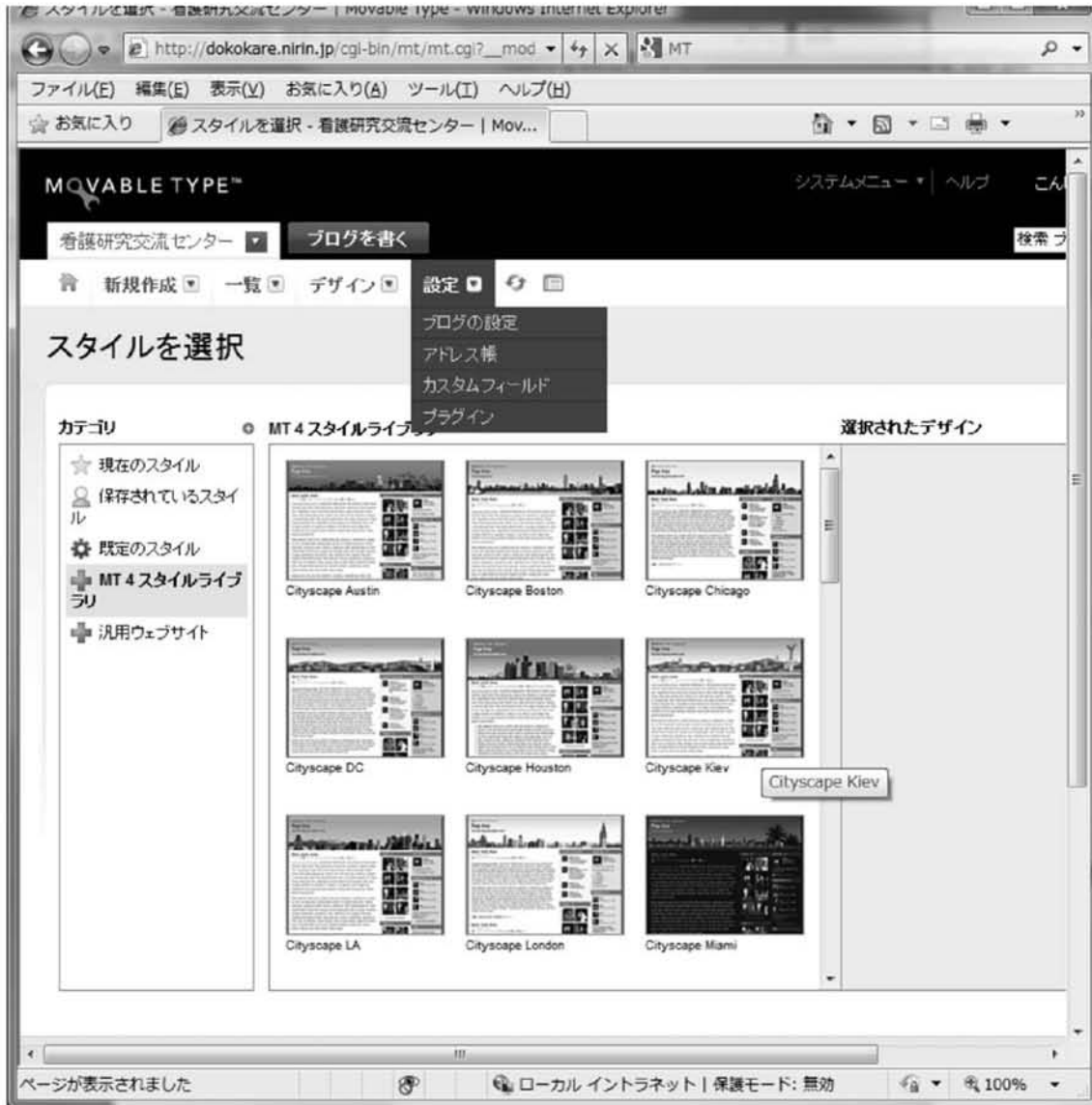
図 4 デザインの選択