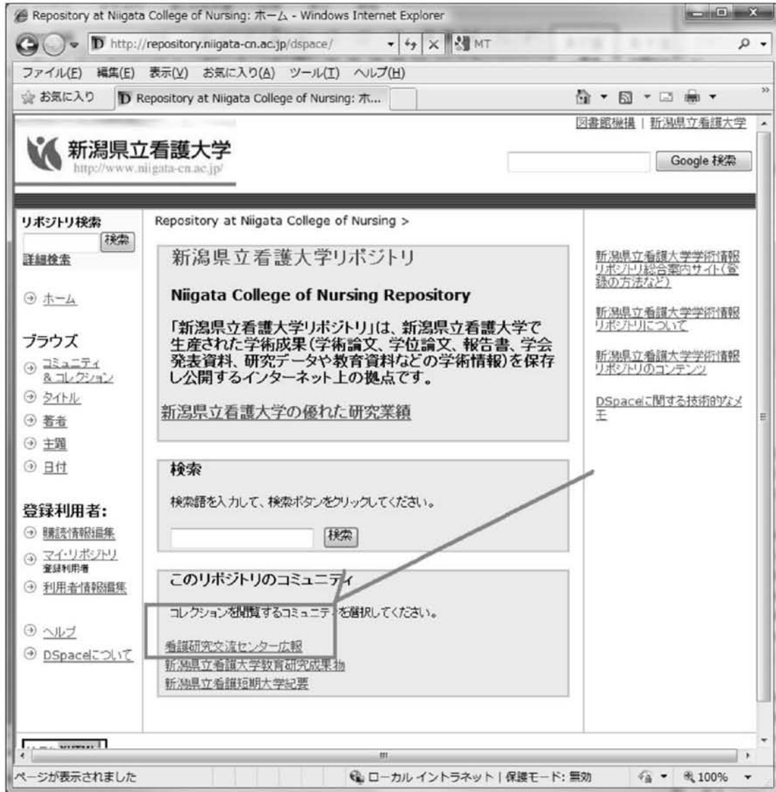
図 6 情報公開の仕組み(実験)