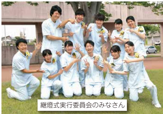
継燈式実行委員会のみなさん