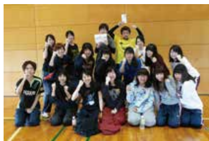
優勝バイキンマンチーム