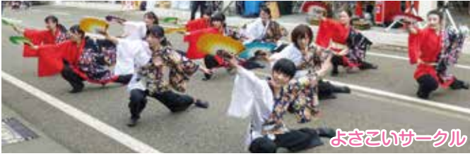
よさこいサークル