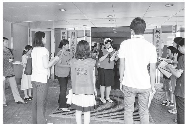
図3 避難所開設支援初動対応訓練(避難者対応を体験)

実際に訓練を実施したことで、マニュアルの修正点が多くなった。具体的には、命令系統の明確化や情報の錯綜防止のために避難所開設支援担当者の中にリーダーを設定し、リーダーに情報を集約する必要性が示された。また、避難者対応において、避難所である体育館を含む大学施設の安全確認中の待機時間に関して、避難者への説明内容をあらかじめ説明例文として準備しておく必要があることも示唆された。また、写真を多く使用し、視覚で支援内容を理解してもらう工夫も必要であることも示され、これらの点をマニュアルに追加した。