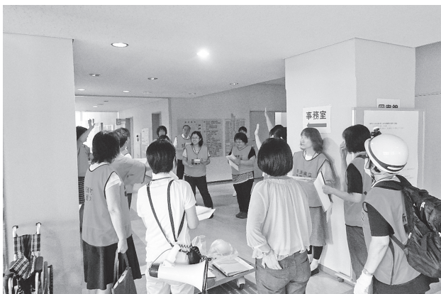
図2 避難所開設支援初動対応訓練(開始時の説明)