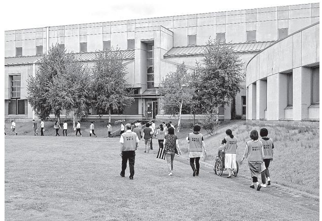
図4 避難所開設支援初動対応訓練(実際に避難経路をたどる)