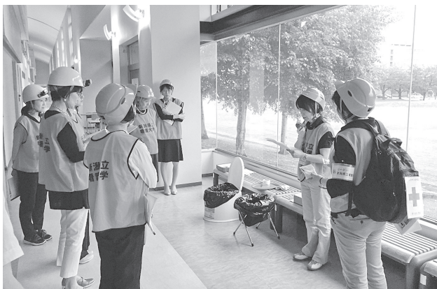
図6 避難所開設支援初動対応シミュレーション研修会<2>