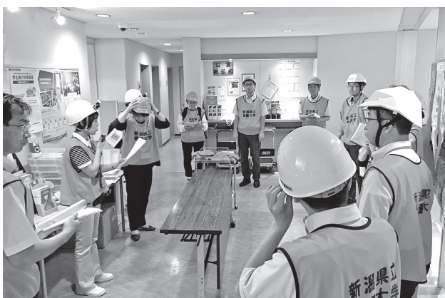
図5 避難所開設支援初動対応シミュレーション研修会<1>

上記の訓練のほかに、ワーキンググループが2013年に開始した教職員を対象とした避難所開設支援初動対応シミュレーション研修会がある。2017年以降は、新任の教職員を対象に毎年実施している。研修会の目的は、2016年に実施した実動訓練と同様である。参加者には実際にヘルメットやビブスを着用してもらい、避難経路を移動しつつ立ち入り禁止テープや非常用トイレなどの実物を見ながら、使用方法について訓練担当者より説明を受けるというスタイルである(図5、6)。参加者からは避難所開設支援初動対応マニュアルの内容を具体的に理解でき、また災害時の避難所開設に対する心構えができたなどの感想を得た。