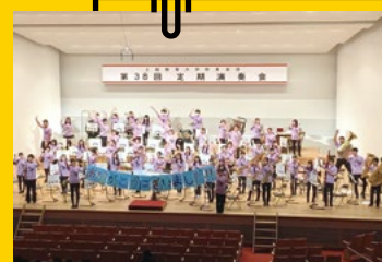
吹奏楽団サークル

ダンスサークルでは、Hip-hopやガールズといったジャンルに加え、完コピなどにも挑戦し、学年関係なくみんなで楽しく踊っています!夏にはサマーライブ、秋には桜蓮祭など、日頃練習してきたダンスを発表する機会もあります!初心者も経験者も大歓迎!先輩方と仲良くなりたい!楽しくダンスがしたい!そんな方、お待ちしています!看護大と一緒に楽しくダンスしましょう!