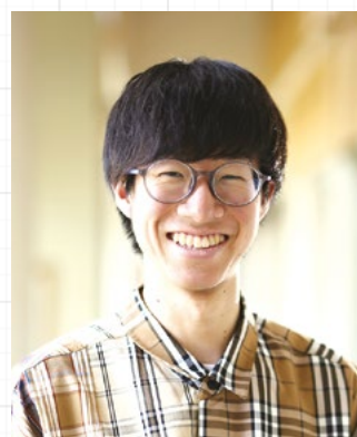
令和2年度 桜蓮祭実行委員長

コロナ禍に入り、思うように学習や学生間交流ができない中で、自治会執行部は感染対策にできるだけ配慮をしながら学生が交流できるイベントを企画し、学生が少しでも楽しく生活を送れるように支援をしています。まだまだ先が見えない時代ではありますが、皆が協力し合い、有意義な時間を過ごしながら看護職を目指す大学づくりを目指します。