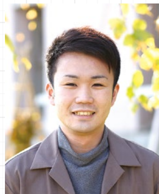
令和2年度 自治会長

自治会では、新入生歓迎レセプション、継燈式、桜蓮祭、球技大会をはじめとした学生の自主的な企画を運営しています。4年間を通して、上級生から下級生の繋がりがもてます。