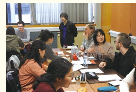
2018年3月 ニュージーランド看護研修