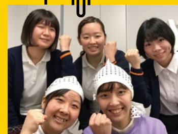
認知症オレンジサークル

フットサルサークルです。昨年はコロナ感染症の影響がありましたが、それでも活動日にはたくさんの方が集まってくれました。楽しい先輩達から大学の話や病院実習でのアドバイスなどが聞けます。初心者の方もたくさんいるので楽しいサークルを作って行きましょう!