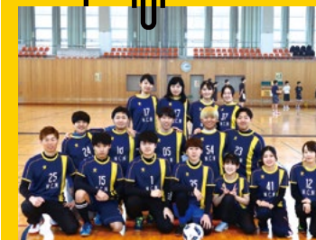
フットサルサークル

吹奏楽サークルは上越教育大学と一緒に活動しています。インカレサークルなので賑やかでとっても楽しいです!春、夏、12月の定期演奏会の3つの自主公演に加えて、地域のイベントでも演奏させていただいています!演奏だけではなく、夏にみんなで海に行く「ウラジオ」など、年間通して様々な行事があります! 初心者も経験者も大歓迎!気軽にご連絡ください!Instagram: jokyo_suisou