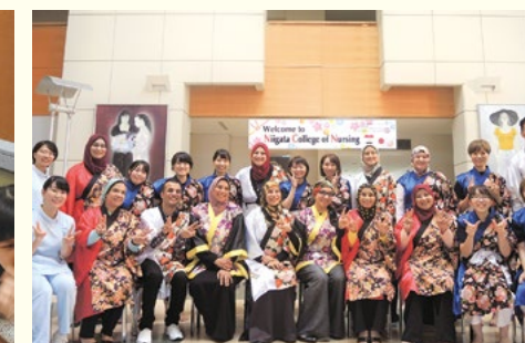
2018年3月 エジプトの看護管理者研修生をおもてなし（エジプト・日本教育パートナーシップ(EJEP)に基づく人材育成事業への協力）