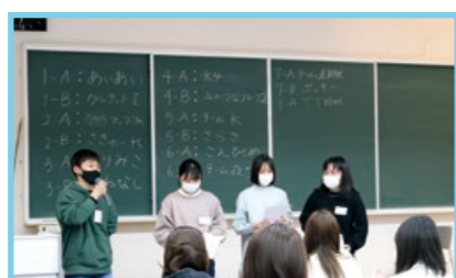
新入生オリエンテーション