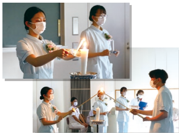
例年は学年全員でろうそくに火を灯す継燈の儀を行っていますが今年度は代表のみで行いました。

2年次の7月頃、臨地実習の前に「継燈式」という儀式を行います。この儀式は歴代の先輩方が受け継いできた看護の燈を受け取り臨地実習にむけて決意を固めるための行事です。2年次生が主体となり式の準備、企画を立案していきます。令和4年度は感染症対策により縮小した形で行いましたが、神聖な素晴らしい式となりました。