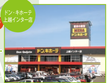
ドン・キホーテ 上越インター店