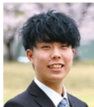
令和4年度自治会長

令和4年度は一昨年度、昨年度に引き続き新型コロナウイルスの影響で、例年どおりの活動ができなかったですが、みんなで協力し工夫を凝らして活動を行ってきました。本学は単科大学ということで優しい先輩方とすぐに仲良くなることができます。自治会を通して各学年のつながりを作る手助けになれば幸いです。