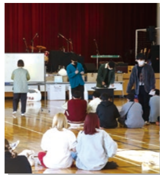
体育館でビンゴ大会をしているところです。