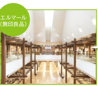
エルマール (無印良品)