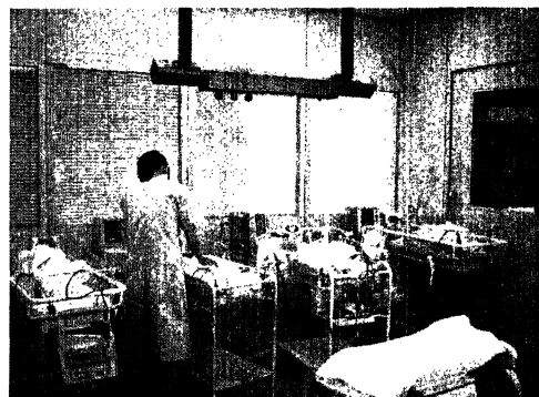
図 2 GCU (Growing Care Unit)