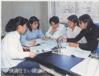
快適住まい環境研究会