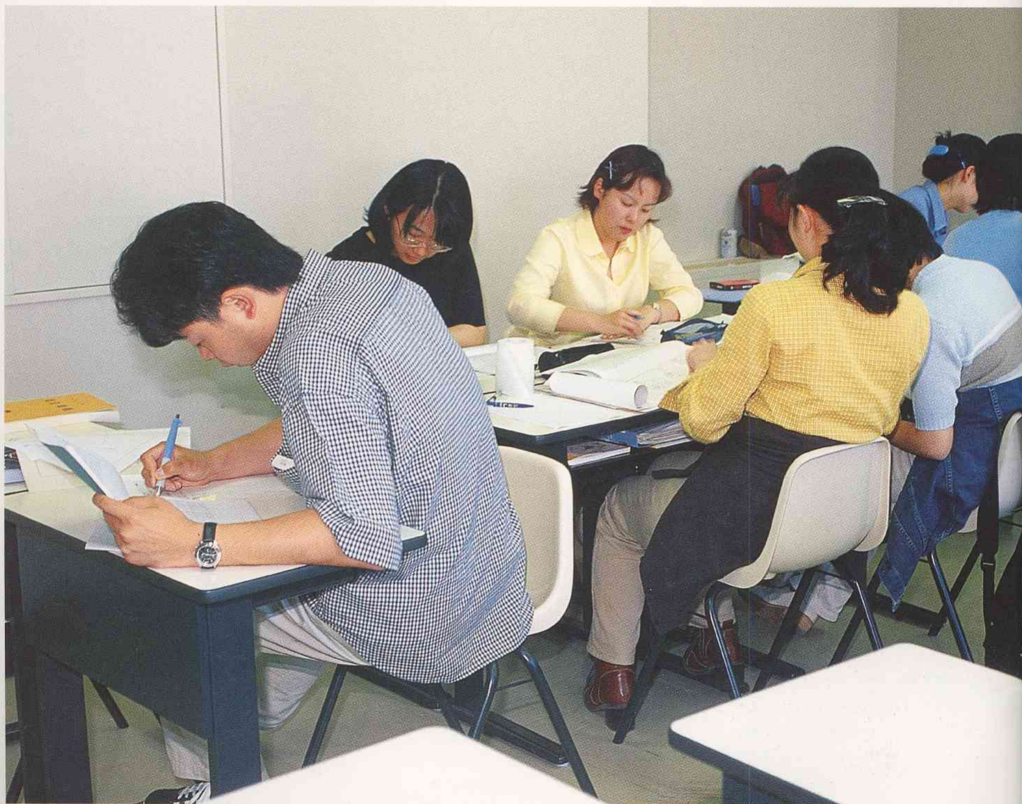
特定の地域をサンプルに統計資料を分析し、地域の人の衛生教育や健康相談のあり方を学ぶ実習風景。

急激な人口の高齢化、健康意識の高揚等に伴い、地域保健ニーズは複雑、多様化しています。加えて医学の進歩も目覚ましく、保健婦(士)には一層幅広く、かつ専門的な知識・技術が要求されています。