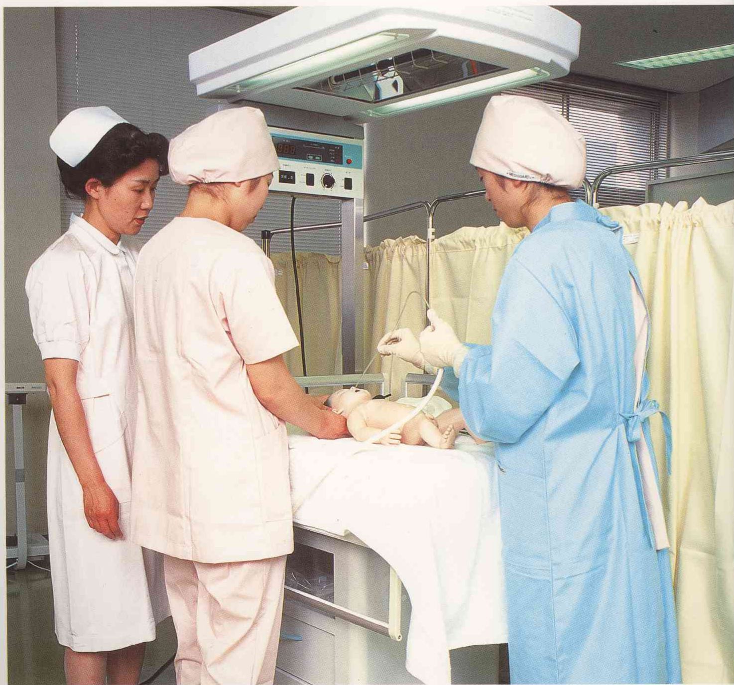
新生児の生理的経過や異常を理解し、ケアの技法を学ぶ実習風景。

核家族の増加、女性の社会進出、出生率の低下、情報社会の進展等、母性や育児を取り巻く環境は急速に変化しています。このような社会環境の変化や保健・医療技術の進歩に対応するため、先見性と柔軟性をもった資質の高い助産婦の養成をめざしています。