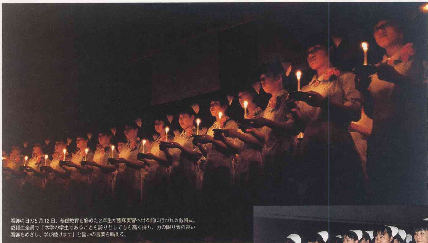
看護の日の5月12日、基礎教育を修めた2年生が臨床実習へ出る前に行われる戴帽式。戴帽生全員で「本学の学生であることを誇りとして志を高く持ち、力の限り質の高い看護をめざし、学び続けます」と誓いの言葉を唱える。

豊かな人間性、冷静な判断力を持つ看護のスペシャリストの育成を目指し、その基礎的能力を養うため本学では、入学から卒業まで、専門的知識はもとより語学などの一般教養も身につけられるようなカリキュラムと、設備や施設の充実を図っています。