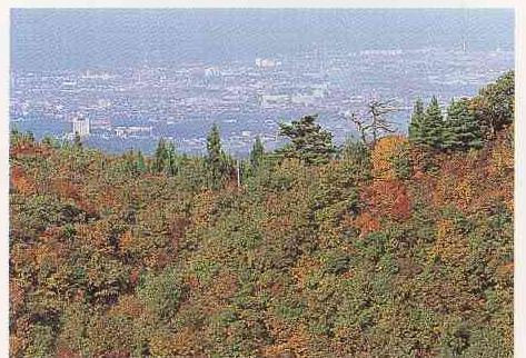
南葉山（キャンプ場）