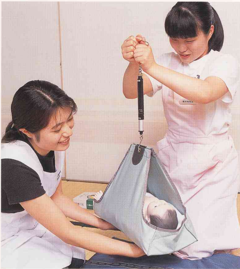
家庭訪問実習に必要な方法や技術を学ぶ演習