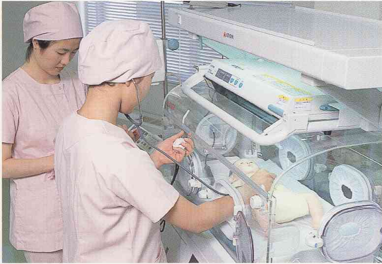
保育器収容中の未熟児を看護する演習