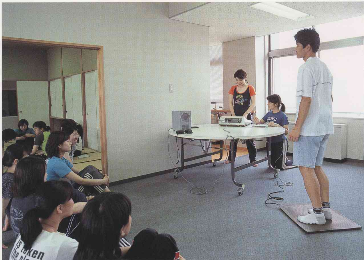
成人の健康づくりに必要な健康教育の方法や技術を学ぶ演習

高齢者の増加や健康意識の高揚などに伴い、地域保健ニーズは複雑・多様化しています。このような社会の変化に対応するため、保健師には一層幅広く、かつ専門的な知識・技術が要求されています。