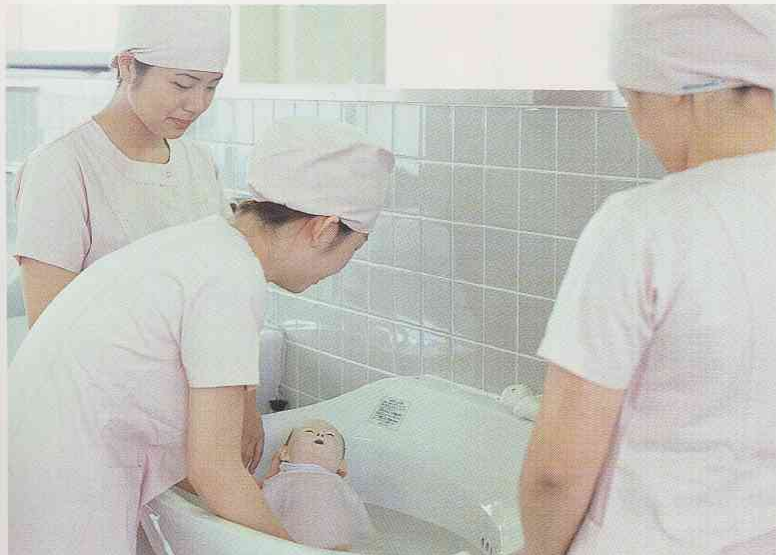
新生児の沐浴演習