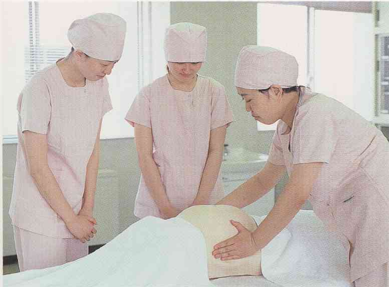
妊娠期の診断・援助の原理と技法を学ぶ演習