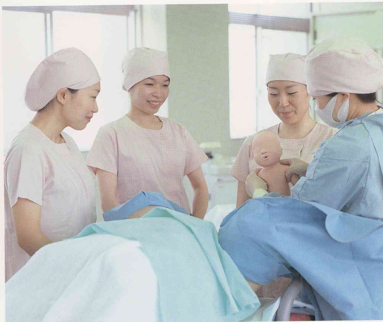
分娩期の診断・援助の原理と技法の知識をもとに、分娩助産の技術を学ぶ演習

核家族の増加、女性の社会進出、出生率の低下、情報社会の進展等、母性や育児を取り巻く環境は急速に変化しています。このような社会環境の変化や保健・医療技術の進歩に対応するため、先見性と柔軟性をもった資質の高い助産師の養成をめざしています。