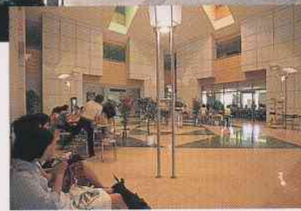
レセプションホール

採光のよくとれたゆったりとしたフロアは2階構造で、教育・研究に必要な図書や雑誌、視聴覚資料などが豊富に揃っています。閲覧席は1階が81席、2階は32席で、他にAV室も設置され教材もより充実しています。