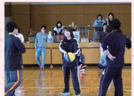
▲球技大会 入学時の緊張も、学外オリエンテーションや球技大会などの親睦行事の後にはほぐれているでしょう。

他には、サークル活動の支援も行っています。室内外のスポーツをはじめ、軽音楽やボランティアなど多岐に渡っています。自分の趣味を生かしつつ、他の人と交流することができます。また、他大学との合同サークルや民謡流しなど地域の催しものに参加するなど学内に留まらず、大学外の活動も盛んです。学外の活動では、普段と違った方々との交流ができ、そこからまた交流が広がっていくことも、とても楽しいことだと思います。