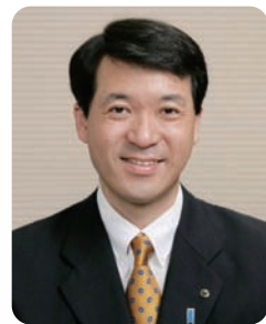
新潟県知事 泉 田 裕 彦

これから入学を希望される皆さんが、豊かな自然と多様な歴史のあるこの上越の地で、新潟県立看護大学の意欲あるスタッフとともに青春の 4 年間で過ごし、高い資質を持った看護職者となり、諸先輩方とともに医療現場等で活躍していただくことを心から期待しています。