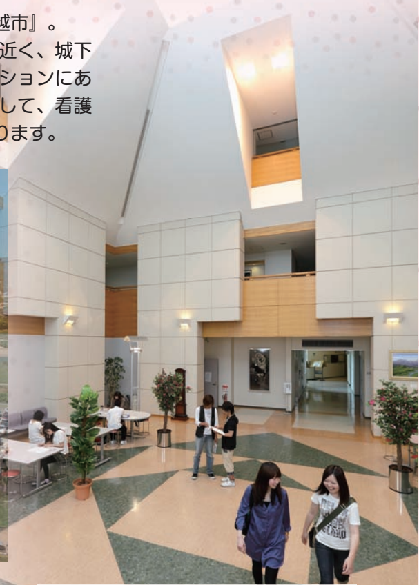
▲レセプションホール

3階まで吹き抜けの広々とした空間は学生の交流の場でもあります。音響効果に優れた建物構造を活かした演奏会などにも利用できます。