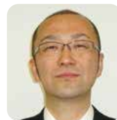
26年度新潟県立看護大学後援会 会長

肌に汗ばむ季節となってまいりましたが、後援会の会員の皆様におかれましては、日々お健やかに過ごしのこととお慶び申し上げます。