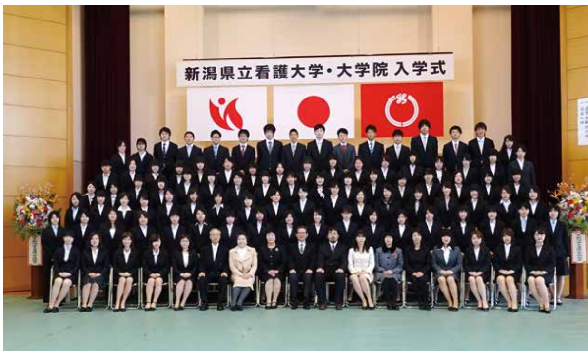
(平成26年度入学1年生)

どうか会員の皆様におかれましては、深いご理解をいただき、引き続きご支援をいただきますようお願い申し上げます。