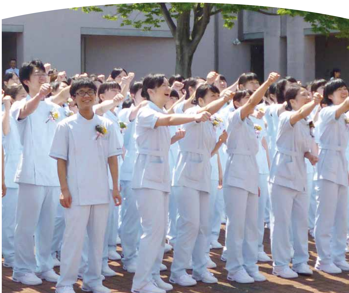
笑顔满面→気力充実！（7月2日継燈式後・ポルティコの広場にて）